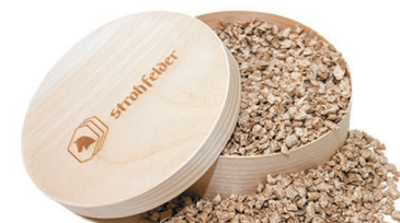
BRILLIANT Innovativt strö av lövträd

Produkterna från Strohfelder® håller jämn kvalitet och är rena, vilket garanteras genom österrikisk noggrannhet, kontinuerlig produktutveckling och kännedom om ströbranschen.