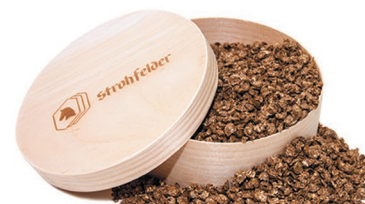
PLATINUM ORIGINAL Innovativt strö av halmkross